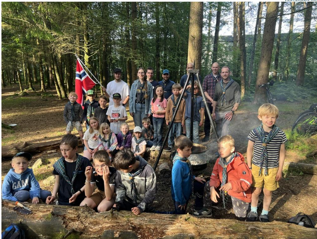
Speidere i 3.Sandnes samlet til sommeravslutning