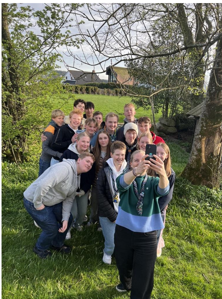
Generalsekretær besøker lederspirene

Ledertreningsuker: Ledertreningsuka i februar ble gjennomført med 50 deltakere fordelt på tre kvelder. I november var over 70 ledere fordelt på 5 kvelder. Vi har i 2025 gjennomført kvelder om Speidermetoden, Sikker speiding, to kvelder med Førstehjelp, tre kvelder Planlegging av speiderturer, to kvelder Barn med utrygg adferd. I tillegg er det gjennomført 6 kvelder med lederstart for totalt over 80 ledere.