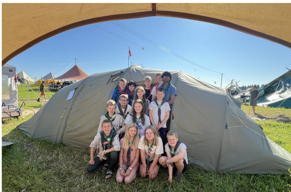
Sola speidere på landsleir Gjøvik.

Årsmøte i Kretsting ble gjennomført torsdag 5.mars 2026 på Sola kulturhus med Sola speidergruppe som vertskap.