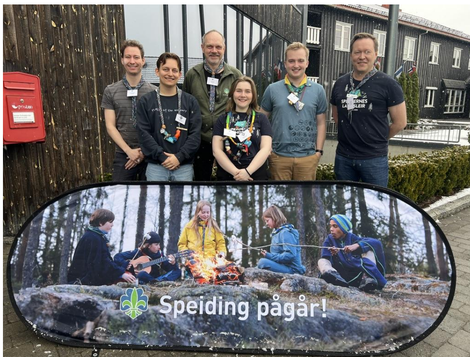
Deltakere fra Vesterlen på kretsledersamling i regi av NSF