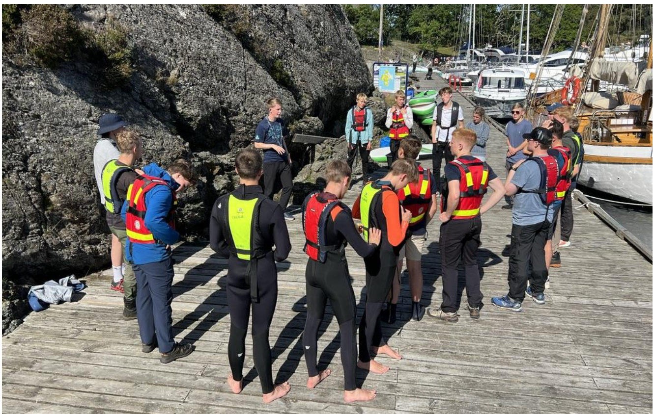
Rovere samlet før nye aktiviteter på Lindøy i august

2025 har vært et aktivt år for roverombudet, med søkelys på samarbeid, aktivitet og gode møteplasser for roverne.