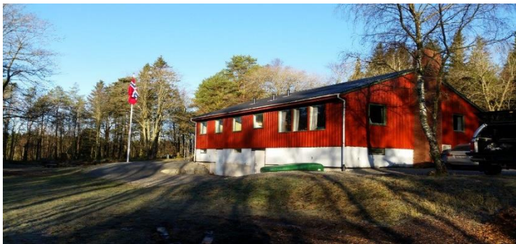
Speiderhytta slik den ser ut idag

Både i dikt og i prosa har hytta av guttene ofte vært besunget og omtalt, og det er sikkert at mange Stavanger-speidere her har fått noen av sine beste speiderminner. Men ettersom årene gikk og guttene ble mer innøvd i tur-, leir- og teltliv, ble hytta mindre uunnværlig. Den var framdeles god å ty til vår, høst og om vinteren som skihytte, og mange herlige feststunder ved leirbålet har den gitt oss førere, men til dette bruk ville den ha kunnet ytet oss atskillig mer nytte om den hadde ligget i mer umiddelbar nærhet av byen. Nå er vår kjære speiderhytte brent ned – forsvunnet som så mange gode verdier i disse år. Framtidens mål bør derfor være å få den erstattet med et «Speidernes Hus». Må dette ikke la vente lenge på seg, når speiderliljen atter vaier fritt i vårt land.