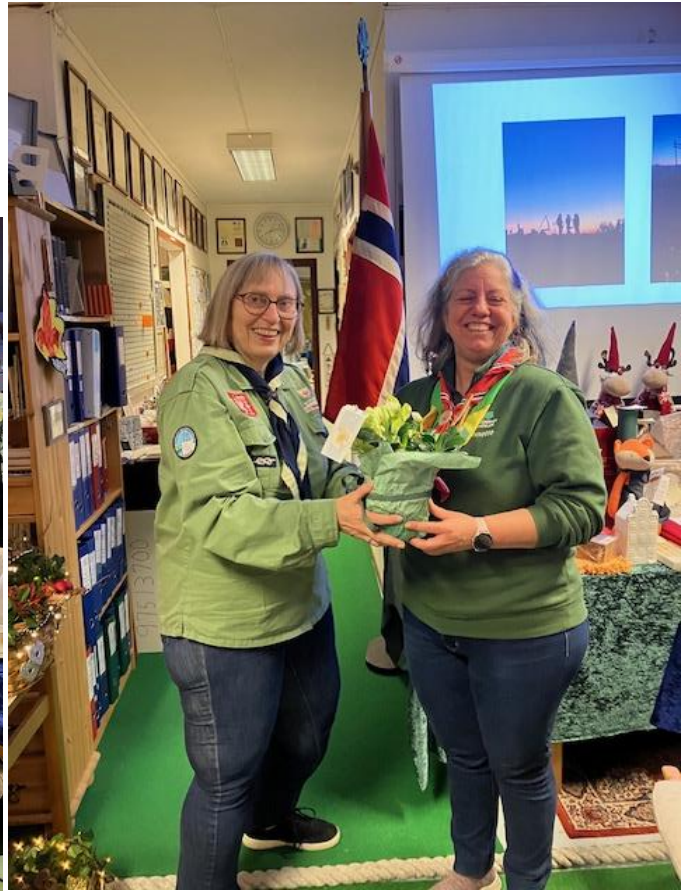
En blomst måtte hun jo ha 😊