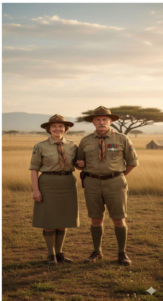
Et flott bilde av Sir Baden Powell og Olave

Stor fest ble arrangert på Speidermarka med hundrevis av speidere og gjester. Vi gratulerer!