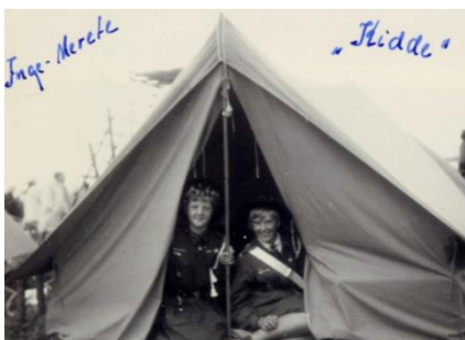
To av mine kjekke jenter